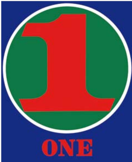
Robert Indiana, Number One, Silkscreen 1968/1997

am Freitag von 18 Uhr bis Mitternacht, am Samstag und Sonntag von 11- 20 Uhr