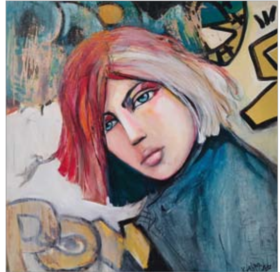
Kalina - Lieblingmensch, 80x80cm

Gleich nach ihrem akademischen Studium der Bildenden Künste folgen zahlreiche Ausstellungen in Deutschland und auch immer öfter im Ausland. Währenddessen durchläuft der künstlerische Weg von Kalina verschiedene Etappen der kreativen Entwicklung und präsentiert damit ihr persönliches Wachstum als Künstlerin. Zunehmend wichtigere Ausstellungen, Projekte, Messe- und Biennale-Teilnahmen auf nationalem und internationalem Niveau bringen ihr zahlreiche Auszeichnungen, Preise und professionelle Anerkennung. Die Werke der Künstlerin sind in staatlichen und privaten Sammlungen, Galerien und Museen in Europa, Amerika und China zu sehen. Kalina arbeitet als freischaffende Künstlerin, führt seit 1995 ihre eigene Galerie in Regen und erfreut sich an der erfolgreichen Zusammenarbeit mit vielen deutschen und internationalen Künstlern, Galerien und Museen.