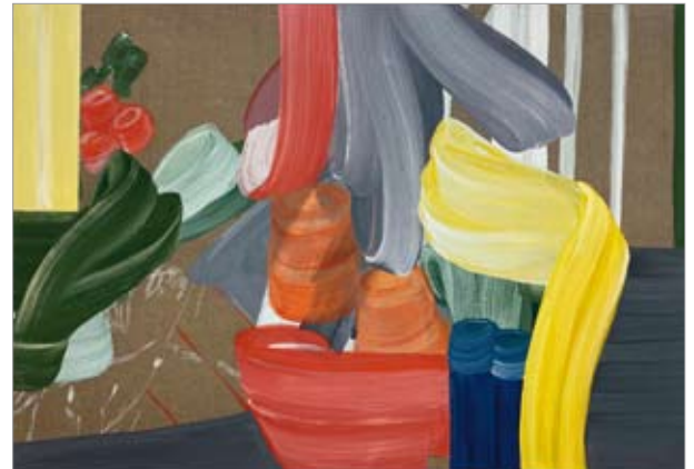
Still-life, 2021, eggtempera on canvas, 80 x 115 cm