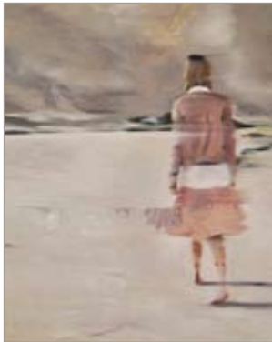
Anke Wohlfart, 140 x 120 cm