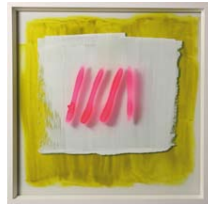
Composition LVII, Acrylfarbe hinter Glas

Die Wahrnehmung von Musik, Geräuschen und Stille löst eine Reaktion aus, die sich in den monochromen Zeichnungen in Form von Linien manifestiert. Sanfte Abdrücke, gestische Spuren und impulsive Eruptionen zeugen von der Dynamik des Entstehungsprozesses.