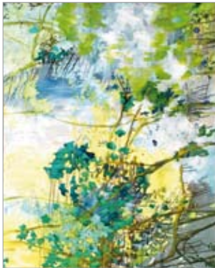
Nicole Bold, 170 x 130 cm