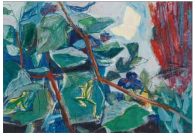
J. Mader, Sommernacht, Tempera und Pastell, um 1970